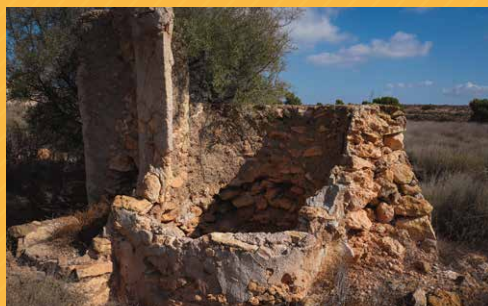
Brocal del pozo hecho de mampostería. M. Parrondo.

Uno de los valores que atesora la finca es la presencia de varias edificaciones y elementos arquitectónicos , hoy abandonados y en estado de ruina, tales como graneros, corrales, aljibes, pozos y estructuras de piedra seca como los ribazos.