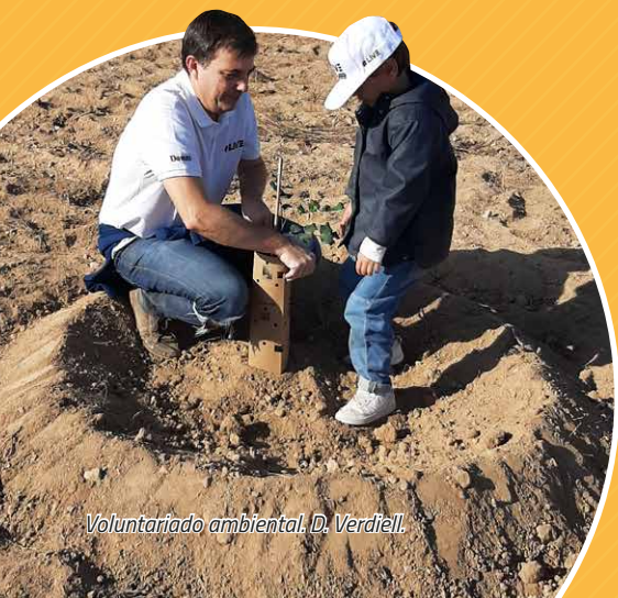
Voluntariado ambiental. D. Verdiell.

Actualmente, las parcelas y bancales de cultivo se han naturalizado con vegetación silvestre y presentan un cobertura y diversidad vegetales bastante importantes, aunque todavía presenta signos de degradación debido a la intensa actividad agrícola desarrollada en la finca durante decenios.