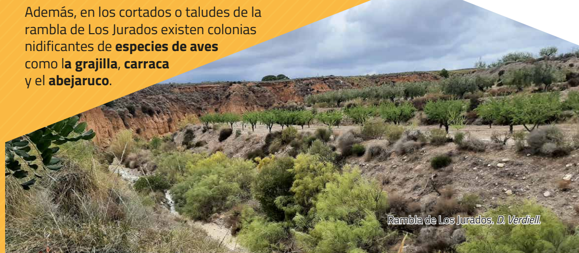
Rambla de Los Jurados. D. Verdiell.