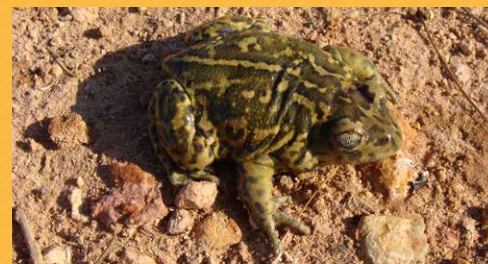
Sapo de espuelas. D. Verdiell.

También podemos encontrar especies de anfibios como el sapo de espuelas y el sapo corredor , que utilizan las pozas que se forman en el cauce de la rambla de Los Jurados, que delimita por el norte la finca, para su reproducción.